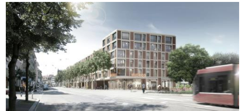
Neubau Migros Breitenrain